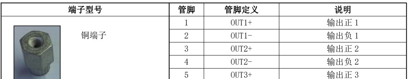
表 12 输出管脚定义表