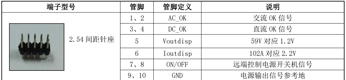
表 13 输出管脚定义表